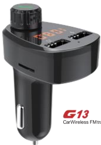
G13 Car Wireless FM transmitter